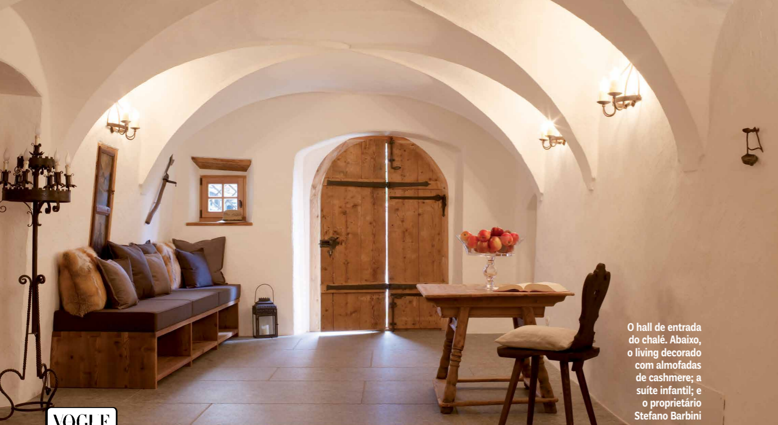
O hall de entrada do chalé. Abaixo, o living decorado com almofadas de cashmere; a suíte infantil; e o proprietário Stefano Barbini

VOGUE NOTABLET Vogue indica três restôs imperdíveis na região das Dolomitas