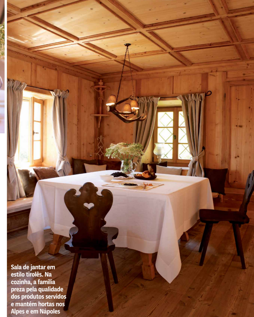
Sala de jantar em estilo tirolês. Na cozinha, a família preza pela qualidade dos produtos servidos e mantém hortas nos Alpes e em Nápoles

VERONA 225 km VENEZA 203 km MILÃO 363 km