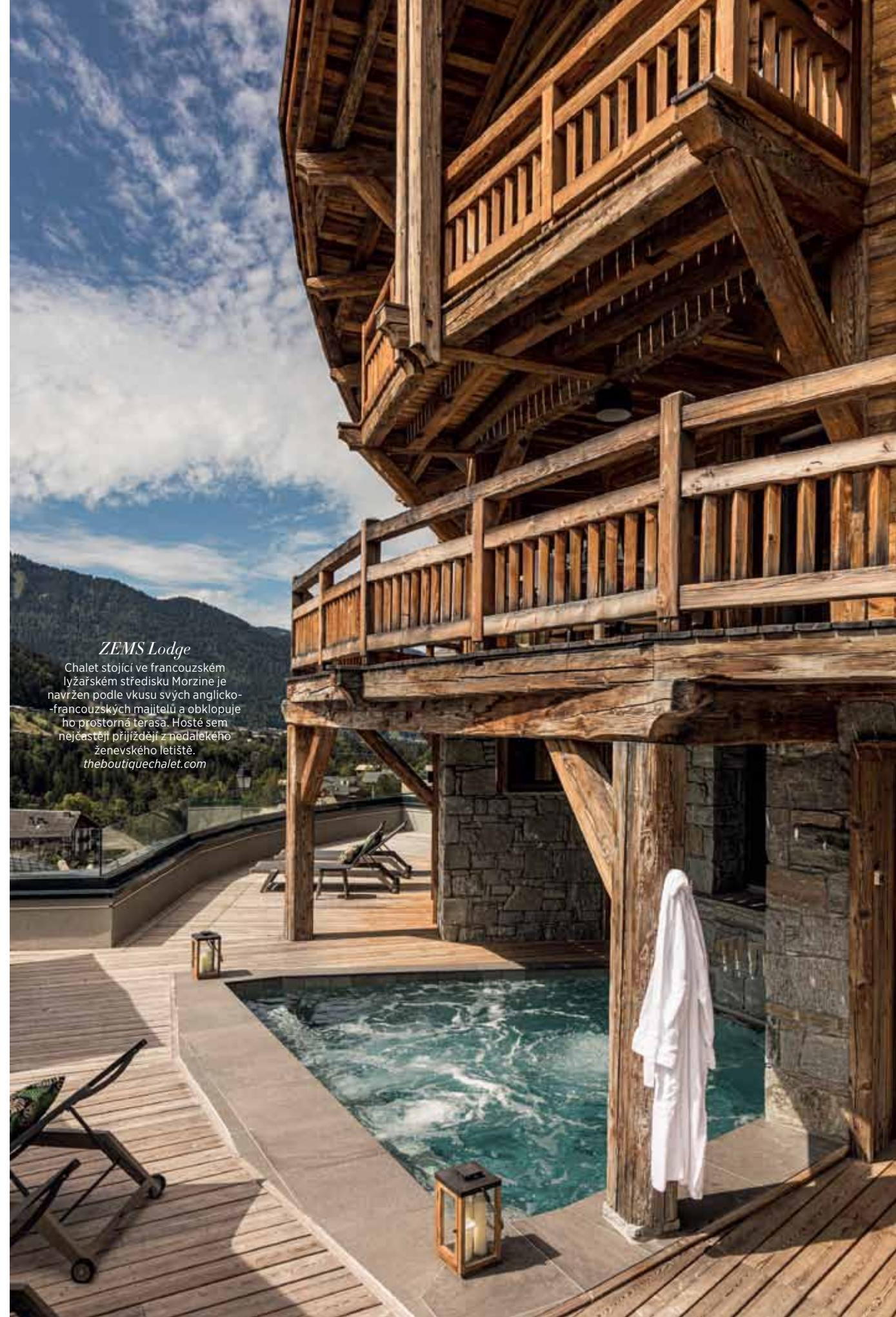
TEXT: VERONIKA SCATTERGOOD

„Bonusem je pak nevyčerpatelná zásoba šampaňského Perrier-Jouët, která je zahrnuta v ceně pobytu.“